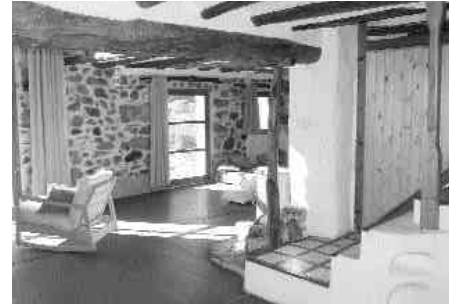
Mar de la Carrasca Tel. 600 603 997 mardelacarrasca@gmail.com www.mardelacarrasca.org