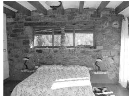
La Posada del Río Carbo Tel. 680 622 077 - 659 612 112 www.laposadadelriocarbo.org

Por su parte, La Posada del Río Carbo ofrece sesiones de reflexología, la posibilidad de realizar excursiones con o sin guía o de conocer e identificar las plantas aromáticas y medicinales, entre otras propuestas.