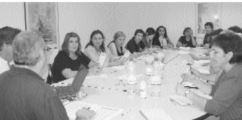
IMATGE D'UN MOMENT DE LA REUNIÓ MANTINGUDA RECENTMENT PER VÀRIES DE LES ESCOLES INFANTILS AGRUPADES EN LA UCEV.

En relació amb tot aquest assumpte, UCEV té previst demanar una entrevista al conseller d'Educació en què traslladar aquesta situació i demanar que de cara al curs pròxim hi haja "major compromís i transparència per part de l'Administració autonòmica, alhora que s'augmenten les partides pressupostàries per a aquesta etapa educativa, fonamental per al desenvolupament futur de les persones".