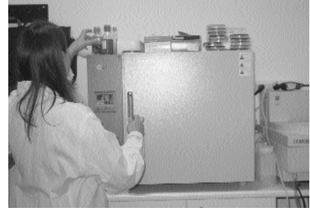
CENTRO DE DIAGNOSTICO VETERINARIO COOP.V (CEDIVET) está situado en Paterna (Valencia) Avda. Benjamin Franklin Tel. 962060227 info@cedivet.es www.cedivet.es