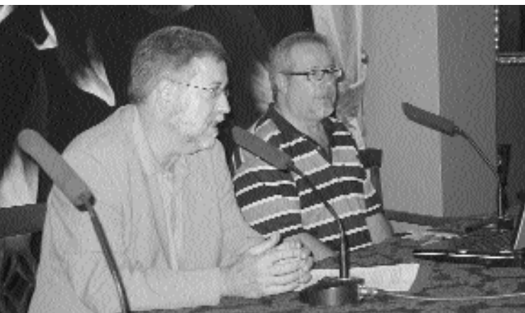
L'ALCALDE D'ALBAL (ESQ.) DURANT LA INAUGURACIÓ DE LA JORNADA.

La sessió va concloure amb un recorregut per les possibilitats d'ocupació existents de cara al futur en sectors econòmics com les noves tecnologies de la informació, els serveis d'atenció a les persones o l'atenció del medi ambient, entre altres.