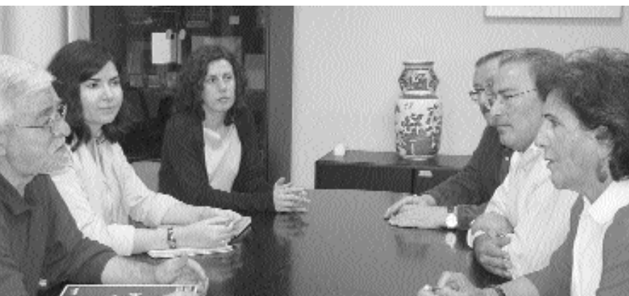
UN MOMENTO DE LA REUNIÓN MANTENIDA POR REPRESENTANTES DE CC.OO-PV Y DE FEVECTA, EN LA SEDE DE LA ORGANIZACIÓN SINDICAL.