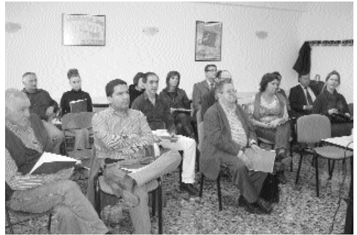
Socis de les cooperatives presents a la Junta Preparatòria de Castelló.

especialment enfocat a professors de Formació per a Orientació Laboral (FOL), així com la realització de tres sessions a Castelló, València i Alacant, per a donar a conèixer l'ús dels materials de suport desenvolupats.