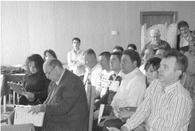
Un moment de la Junta preparatòria de Comarques Centrals, celebrada a Alberic.