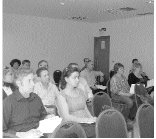
A la Junta d'Alacant assistiren 22 cooperatives de la província.