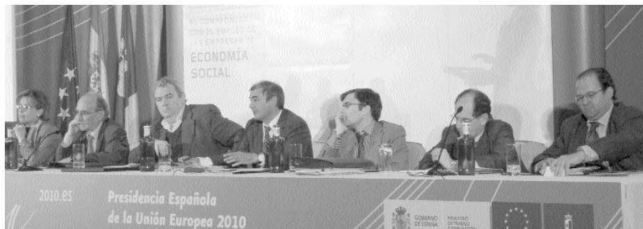
UN MOMENTO DE LA ASAMBLEA GENERAL DE CEPES, CELEBRADA EN TOLEDO.