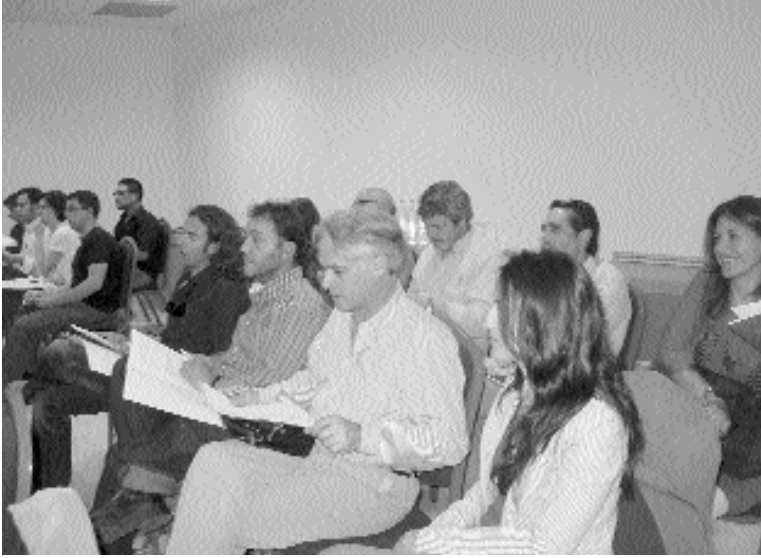
Assistents a la Junta preparatòria de València.