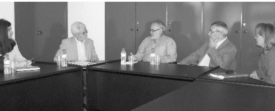
LES DELEGACIONS DE FEVECTA I UGT-PV, DURANT LA REUNIÓ MANTINGUDA EN LA SEU DE L'ORGANITZACIÓ SINDICAL.

"La Comunitat Valenciana del Segle XXI: Una societat sostenible" advoca més per una "profunda reestructuració de l'actual model," que passaria per "optimitzar el seu potencial", que per una substitució real del model valencià. I, entre altres ingredients necessaris, assenyala una reindustrialització de l'economia, un augment de la productivitat, un treball de qualitat i sostenible en el temps o un pacte nacional per l'Educació per a millorar la formació dels joves i respondre a les necessitats del sistema productiu.