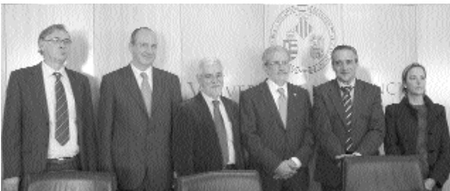
FOTO DE FAMÍLIA DELS SIGNANTS DE L'ACORD ENTRE LA UNIVERSITAT DE VALÈNCIA I LA RED EMPRENDES.