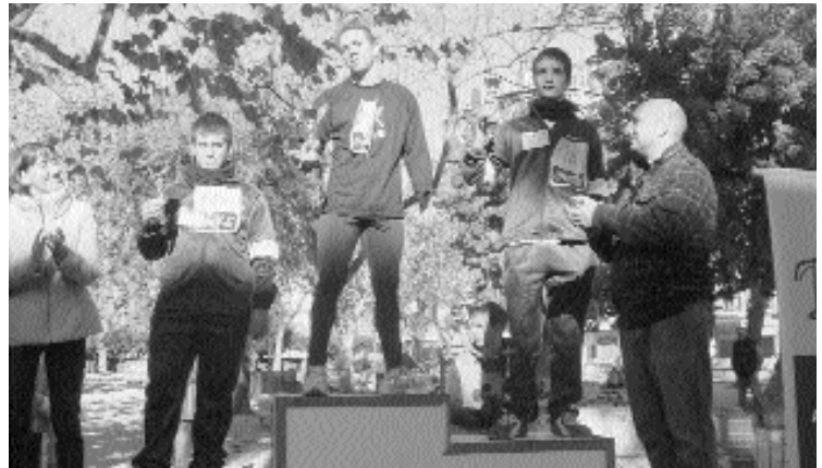
Podi dels vencedors de la cursa popular en les categories masculina i femenina.