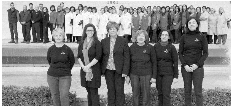
Las socias de la cooperativa Serlicoop.

Como ya he citado, el momento que generó estabilidad en la empresa y en la plantilla fue la concesión del S.A.D. del ayuntamiento de Petrer, a estos le siguieron otros ayuntamientos. En el 98 se incorporó una segunda generación de socias jóvenes, tituladas universitarias que dotaron a la empresa de "estrategias empresariales" y de una planificación de la empresa por áreas y sectores, tratando de añadir