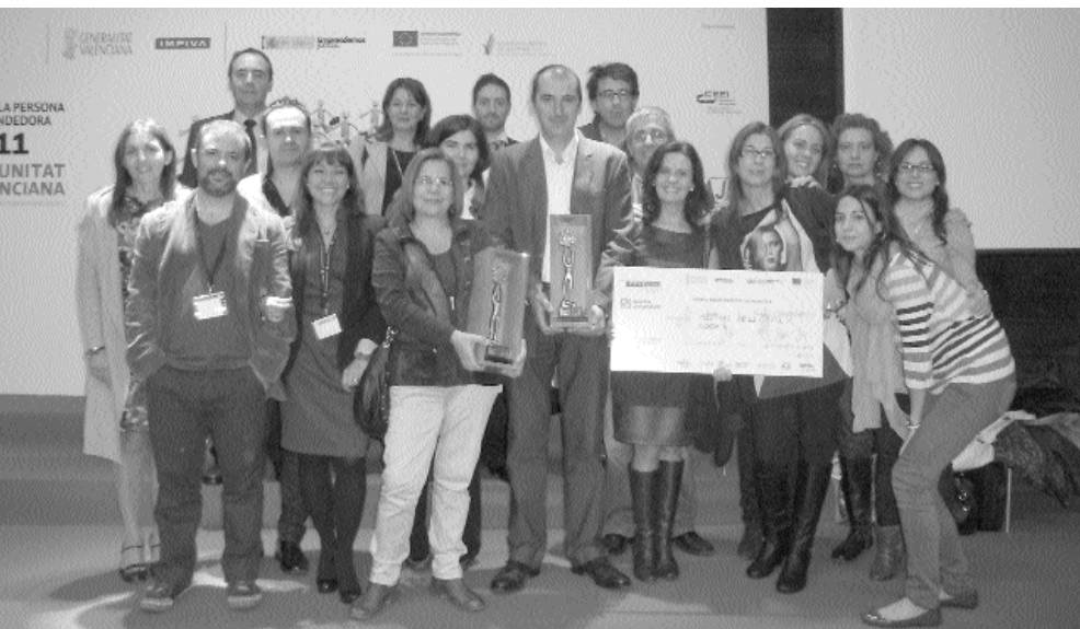
SOCIS DE MESTRES DE LA CREU I DE FLORIDA CENTRE DE FORMACIÓ, DURANT LA RECOLLIDA DELS GUARDONS.